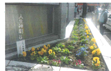
西口も花いっぱい!