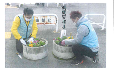
万人幸福の葉のPOPを添付