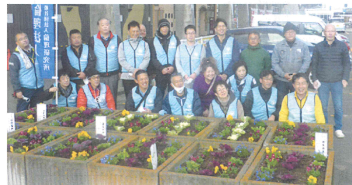
作業を終え、会員にも笑顔が咲きました

恒例になりつつある駅前花いっぱい大作戦。奉仕作業の一環として駅前を花であふれさせようと始まったこの取り組みも、回を重ね3回となりました。