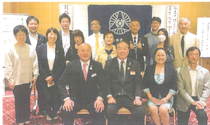
モーニングセミナー後、講師(前列左端)を囲んで、53名の参加がありました

とにかくすべてが気に食わなかった。暴走族幹部になって暴れまわり、警察のお世話になったこともある。社会に出れば父の会社は倒産し、借金2億5千万。従業員に厳しかったと思う。そんな私が倫理に入会して15年…気づきと実践で借金は完済。そしてこの間の退職者はゼロ。現在は社員全員の年収600万円以上目指している。ドン底から逆転のきっかけとなった秘訣とは?波乱万丈の人生哲学を語った7月5日、6日に行われたNS、MSをレポートします。