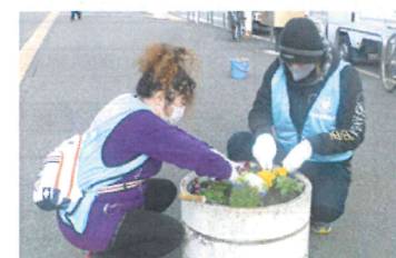
駅が明るくなったと言われました