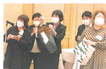
倫理後の懇親会の抽選会は大盛況