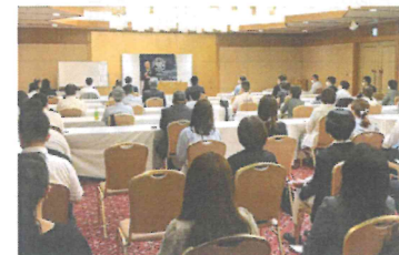
NSには81名の参加がありました

私がやっている5つの実践。①決める。いつまでに何のために書く。②即行の実践。すぐやる。すぐ起きる。すぐ払う。請求書が来たら5日までに手数料込みで払う。③約束を守る。先約優先。④人の話を聴く。目を見てうなずいて聴く。⑤あきらめない。リーダーがあきらめなければ好転する。父が不渡りを出した時に社員を集めて「もうだめかもしれない」と言った。その後、2回目の不渡りを出して倒産。リーダーの心が折れた時に倒産へと進んだ。