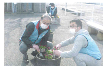
今年度は3回行いました

第1回は令和3年9月29日で45名の参加、第2回は令和3年12月19日で22名の参加、第3回は令和4年6月28日で36名の参加がありました。今治駅前が季節を彩る花でいっぱいになると、市民のみならずはじめ、駅利用者の方々などたくさんの笑顔も花開きます。ぜひ、次回もご参加ください。