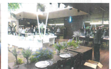
締めは「上げ潮じゃあ!」3本締め