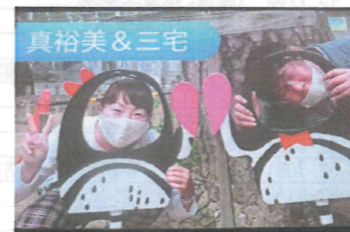
おむすび?ペンギン?あんたら何?