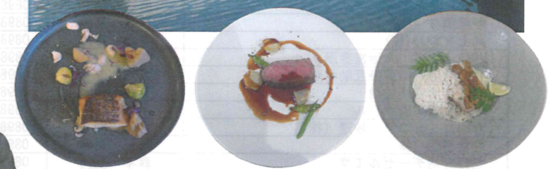
もはや芸術?おいしい季節のコース料理に舌鼓

フィナーレは待ちに待った豪華景品?が当たる抽選会です。当選番号が読み上げられる度に会場から「やったー!」「ぎゃー、うれしい!」「なんで当たんのや?」の悲鳴に似た声が。ほとんどの参加者に会員が持ち寄った余物のジャンパーやケーキなどの景品がプレゼントされました。披露宴のような楽しい交流時間は夢のように過ぎていきました。