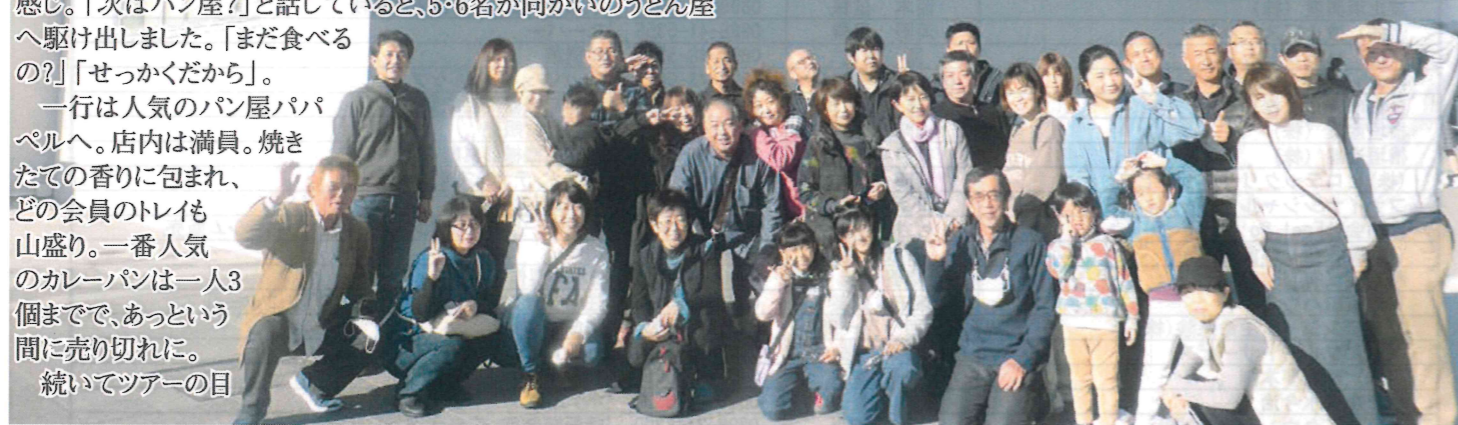
四国水族館にて「まぶしい~!」

大満足、大満腹で親睦を深め合った一日が暮れていきました。34名の参加がありました。