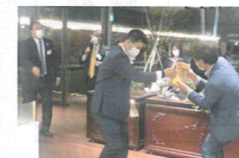
大いに盛り上がった抽選会