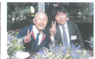
新郎新婦の席におっさんカップル