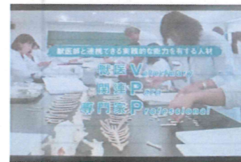
獣医学部の紹介スライド