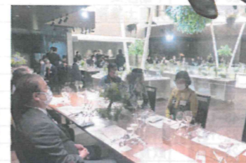
エレガントなしつらいの交流会会場