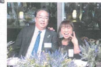
新郎新婦?固まる安永会長