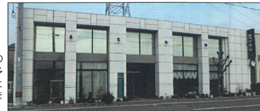
ショールーム「KID LAB.」を併設。多種多様な商品を、手にとってご覧いただけます。見学自由。

2012年8月入会 今治市大新田町2-2-37 TEL 23-7643 【業務内容】カーテン、ジュータン、クロス張り等の内装全般、リビング家具