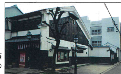
白壁と瓦斯灯が目印。手前が「ぎやらしい風早」、右奥が呉服すがたや

FMラチオバリバリ (78.9MHz) で倫理法人会番組「はい!よろこんで!!」放送中! 火曜日7:45~8:00、金曜日(再放送) 7:15~7:30 出演したい方、どしどしお問い合わせください。企業PRにもなりますよ!