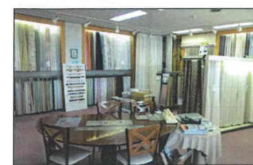
多彩な商品を手にとりて選べるショールーム「KID LAB.」