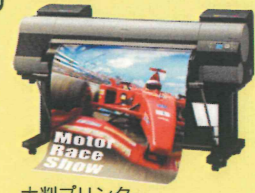
大判プリンター Canon iPF8000S