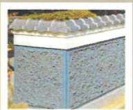
ブロック塀瓦の施工例