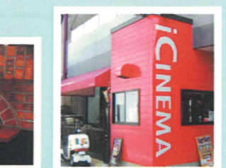
高級車1台分の値段の石窯 アイシネマ1Fにあります

今年2月にオープンしたナポリピッツァ専門店ラ・ソワレ。500℃を超える石窯で焼くピッツァは約90秒で焼き上がり、外はサクッ、中はモチッとした生地のおいしさが評判です。「生地は長時間熟成したものを手延ばしてあります。今治焼鳥をトッピングした『鳥林ピッツァ』や兵庫のハーブ園から直送のバジルペーストを使った『史子ママのジェノベーゼ』など生地や食材にもこだわっています。ピッツァを作るプロセスも楽しいパフォーマンスです。焼き立ての熱々をお召し上がりください。宅配も始めました」 2003年8月入会 今治市共栄町2-2-20 【営業時間】11:30~14:30、17:30~22:00 定休日/火曜日