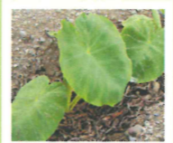
元気に育った里芋