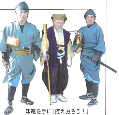
印籠を手に「控えおろう!」

最終目的地「夢菓房」で和菓子のショッピングを楽しんで帰路に。抱えきれない程の景品やおみやげを手に、倫友たちは「楽しかった!」「また来年!」「飲み過ぎた…」などの言葉を残して三々五々家路につきました。34名の参加がありました。