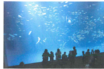
四国最大の650トン水槽