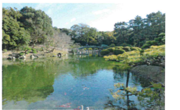
特別名勝の栗林公園