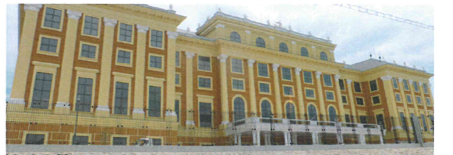
新都市にある世界遺産?シェーンブルン宮殿工場