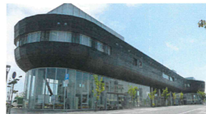
「はーばりーも塗っちゃいました」