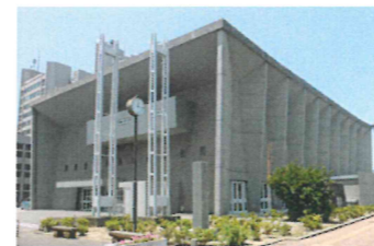
丹下健三氏設計の公会堂の塗装を担当