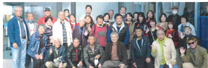
四国水族館入口前でいきなり記念撮影。トドがいる!タヌキが!カバも!それ、動物園