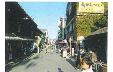
こんぴらさん参道でショッピング