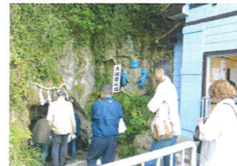
鬼がいたと言われる洞窟に入る現代の鬼達

60代と思われる男性の現地ガイドが「おはようございます。鬼ヶ島へようこそ。バスでご案内いたします」と乗ったバスは「田舎のバスはオンボロバスで〜」と歌に出て来るようなバスで、車内は狭く、けたたましいエンジン音で走り出しました。周囲7.8kmの小さな島の山道を少し揺られたかと思いきや、はやお目当ての鬼ヶ島大洞窟に到着。「へえ、ここに鬼が住んでいたんだ」