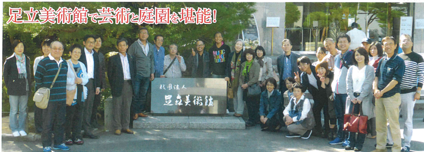
15年連続で日本一に選ばれた名園を誇る足立美術館の入口で。来年の評価が落ちるのではと心配させる「美」にまったく無関心無頓着な一行

10月21日(日)恒例の今治市倫理法人会 親睦バスツアーが開催されました。今回のツアーは「世界に誇る名庭園と名画に感動!足立美術館」。アメリカの日本庭園専門誌で桂離宮(2位)などの名だたる庭園を押さえ、15年連続日本一を達成した島根県にある名園です。また横山大観の収蔵作品は130点を誇り、質量とも日本一です。他に上村松園や川合玉堂など日本画の巨匠作品や、北大路魯山人、河井寛次郎の陶器も多数収蔵しています。