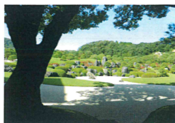
一幅の絵画のような日本庭園