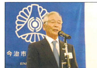
気付きがたくさんあった講座

倫理経営基礎講座は月1回、火曜日18:30~19:30に今治国際ホテルで開講しています。会員は誰でも参加できます。講座終了後、講師を囲んでの懇親会もあります。次回は12月18日(火)です。ぜひご参加ください。