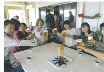
なにはともあれ「カンパ〜イ!」