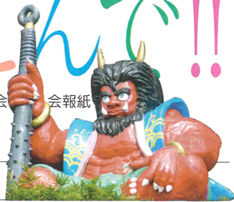
鬼ヶ島こと女木島に立つ?座る?巨大な赤鬼