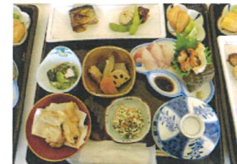
現代の鬼も大喜びの昼膳