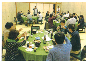
亀嵩温泉で昼食。改めて「カンパ〜イ!」