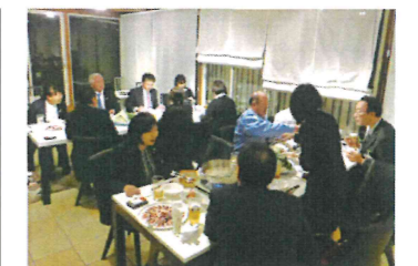
講師を囲んでの懇親会のようす