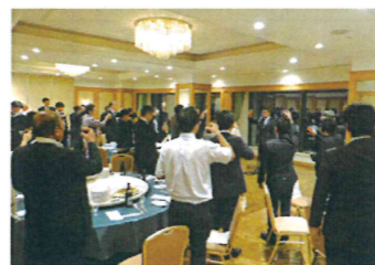
会員総会後の懇親会「カンパ〜イ!」