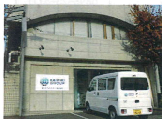
今治セレモニー会館近くにありますが

液体インクを使用するプリンター。カートリッジの交換が不要で、船舶やオフィスに最適です(左上) ただいま今治にて孤軍奮闘中(右上)