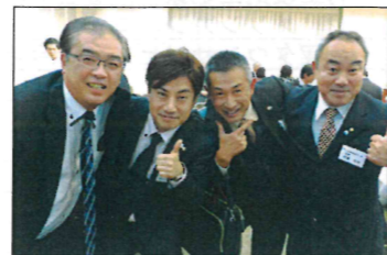
新年会の酔っ払いの面々。なにがなんだか