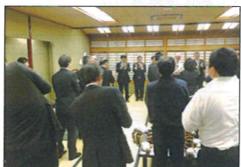
右肩が上がらない五十肩の面々