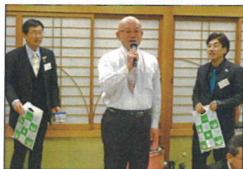
今造君グッズが当たり大喜びの野住講師