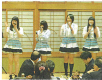
愛媛女子芸能部によるアトラクション