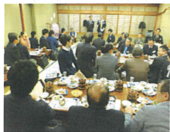
満員御礼となった新年会

続いて恒例の、会員が持ち寄った豪華景品による抽選会が行われました。宿泊券や食事券、日本酒、ヨーグルト、時計、ジャンパーなど次々と抽選が行われ、その度に「当