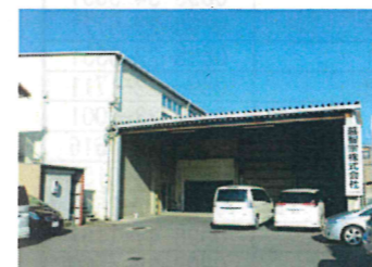
フレッシュパリュール本店近くにあります