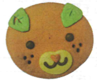
みきゃんとパリュールのクッキー(各500円・税別)