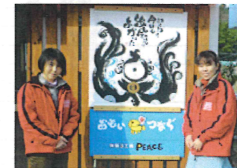
美人姉妹がやってま〜す!

木の香り漂う店内(左上) 地元作家による雑貨も展示されています。道の駅・風和里から松山方面へ約300m、アイスクリーム・ブルーヘブンとなり 2015年10月砥部より移籍 松山市下難波1427-62 TEL 089-992-2006 【業務内容】洋菓子・パン製造 【営業時間】平日/11~16時、金・土・日・祝/11時~夕暮れまで