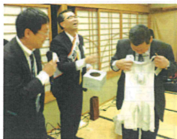
婦人服が当たり大喜びの重松相談役(右)