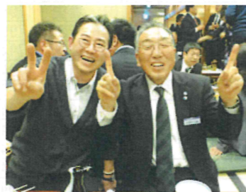
菅波会員(左)と緒方法人レクチャラー