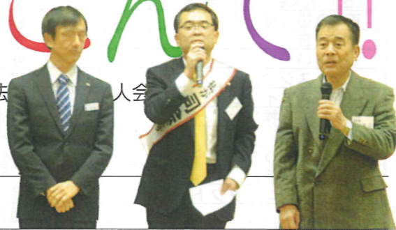
市長に立候補かと思いきや、ただの司会だった榎垣専任幹事(中央)と光藤会長(左)ご参加いただきあいさつを述べられる菅市長(右)