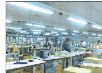
自動裁断機(左上) ミシンによる縫製作業。海外研修生も多く働いています。(右上)