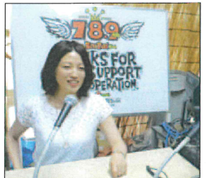
水鏡さん、ラジオバリバリ収録中!