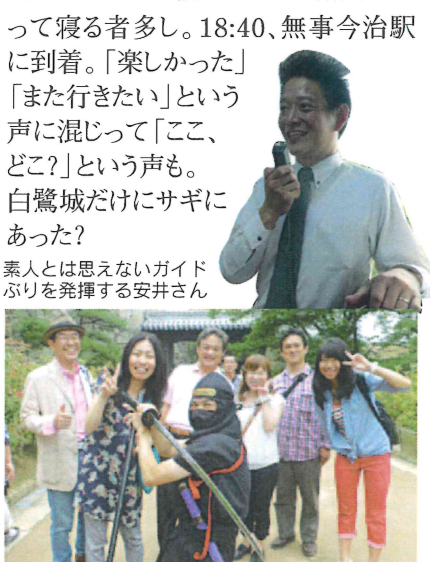
忍者も混じって仮装行列?