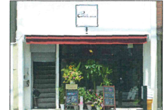
常盤通り大丸跡地前に移転オープン!

2014年2月入会 今治市常盤町4-3-8 TEL 35-2156 営業時間/ 11:00~15:00(L.O.14:30) 17:00~23:00(L.O.22:30) 日曜定休 【業務内容】ダイニングカフェ