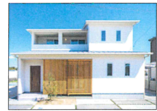
木の香りあふれる家づくりが評判です。

「親父が建てた家はいいという評判だったので、親父には感謝しています。それを財産に家を建てるなら藤田ハウスと言われるようになりたいですね。」