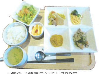
人気の「健康ランチ」780円

「以前勤めていた会社で、モーニングセミナーに強制的に行かされていましたが、通っているうちに習慣となりました。仕事のスイッチが入り、一週間のリセットができます。ある講師の『人生はらせん階段だ。業績が悪い時も少しずつ上がっている』という話を聞いて、へこんでいた時だったので、もうこれ以上は落ちないとプラス思考になれました」。