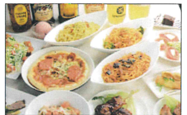
オーダーバイキングが人気です。

「今は丸1日オフになることはないです。しんどいですが楽しいですね。倫理を勉強しているからか休みたいとは思いません。将来、もう1店舗出したいと思っています」。