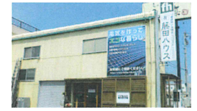
産業道路沿いやマガ電機 前にあります。

2015年5月入会 今治市衣干町2-2-35 TEL 33-0073 【業務内容】新築・リフォーム・土地探し・GOKAN 木の時計