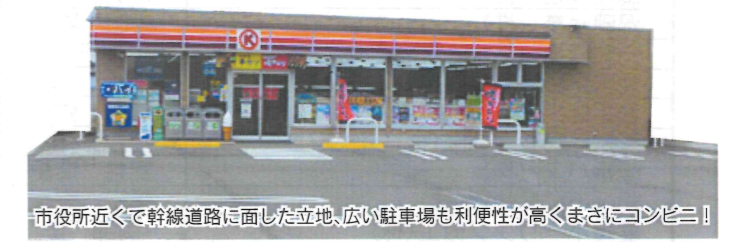
市役所近くで幹線道路に面した立地、広い駐車場も利便性が高くまさにコンビニ!

2012年7月入会 今治市別宮町4-5-20 TEL 32-3855 【業務内容】コンビニエンスストア