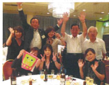
達成に盛り上がる会場