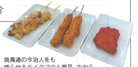
焼鳥通の今治人をも 惚らせるテイクアウト商品。左から 「鳥皮(塩)」、みそだれ・特製ソース付「豚串カ ツ」、「うまからフライドチキン」