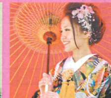
和装が人気急上昇中