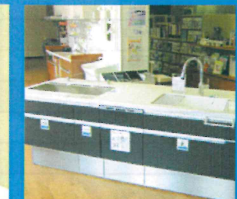
最新のシステムキッチン等を取り揃えたショールームを完備