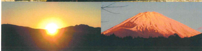
ご来光 朝日に赤く染まる富士山

3日目。朝日に赤く染まる富士山とご来光。そして、今後の決意策定。自分の今までを振り返り、助けられていることに改めて感謝する機会と出会いの場をいただき感謝しています。