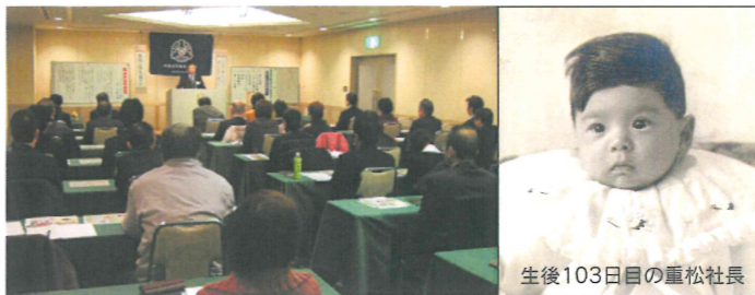
生後103日目の重松社長

(プロフィール) 1959年12月生まれ。1984年4月 重松建設(株)入社。2002年10月 同社 社長就任。2003年9月 今治市倫理法人会モーニングセミナー委員長。2006年9月 今治市倫理法人会副会長。2009年9月 今治市倫理法人会会長。