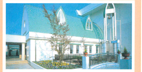
大勢の皆様幸せと感動の舞台・マリエール今治

「あなたが幸せでありますように そしてそれが私たちの幸せでありますように」の企業理念のもと、大勢の皆様のお手伝いをされているマリエール今治は、今年創業45周年を迎えます。「『まるごとマリエールプラン』(40名様100万円、挙式・披露宴・衣装・前撮り写真のセットプラン)が人気です。式を挙げられてない方や記念日のお写真を撮りたい方に『ディアマリエールフォトプラン』(8万円~、衣装・着付・写真のセットプラン)がおすすめです。「結婚式には多額の費用がかかります。当社の互助会システムでお積立てをされることをおすすめします」。2010年2月入会 今治市郷本町1-1-35 【業務内容】結婚式場