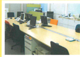
最先端オフィス仕様の事務所内