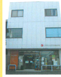
1階では事務用品や消耗品を販売

「みんなの力で一番店になろう!みんなが…もっと幸せになろう。」の経営理念のもと、主に市内の企業、官公庁にOA機器、オフィス家具をリース・販売しています。席を自由に移動できる最先端オフィス仕様の事務所には、各メーカーの2~20万円のイスが多数備えられています。「お客様に色々なイスの座り心地を体感してもらいたいから」とのこと。1階では文具・事務用品を販売。「リコー純正サブライも多数取り揃えています」。2009年12月入会 今治市常盤町6-7-37 【業務内容】OA機器・オフィス家具のリース・販売 RICOH正規代理店 【営業時間】(平日)8:30~19:00、(土)9:00~18:00 日休