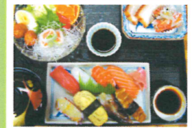
ランチ「なわぶね定食」(要予約)も人気